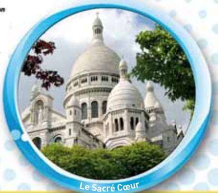
Le Sacré Cœur