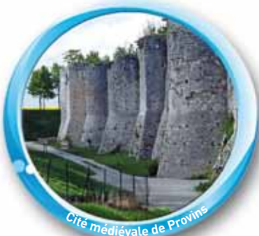
Cité médiévale de Provins