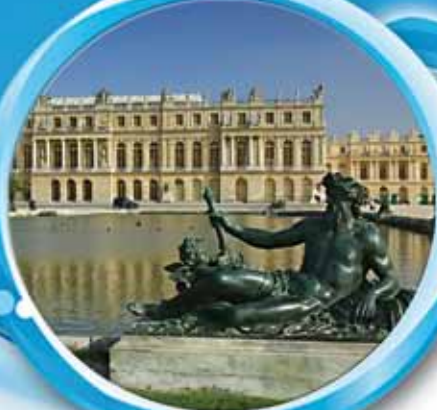
Château de Versailles

Découvrez, seul, en famille ou entre amis les charmes de notre belle région. Paris et la richesse de son patrimoine, les balades à la campagne et la visite des sites historiques à proximité vous procureront un séjour des plus agréable.