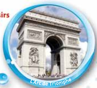
L'Arc de Triomphe