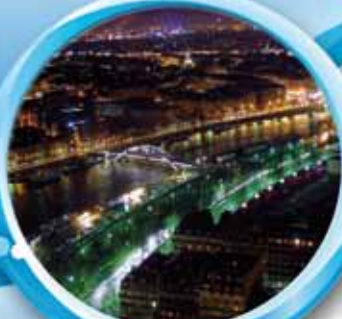
Paris «by night»